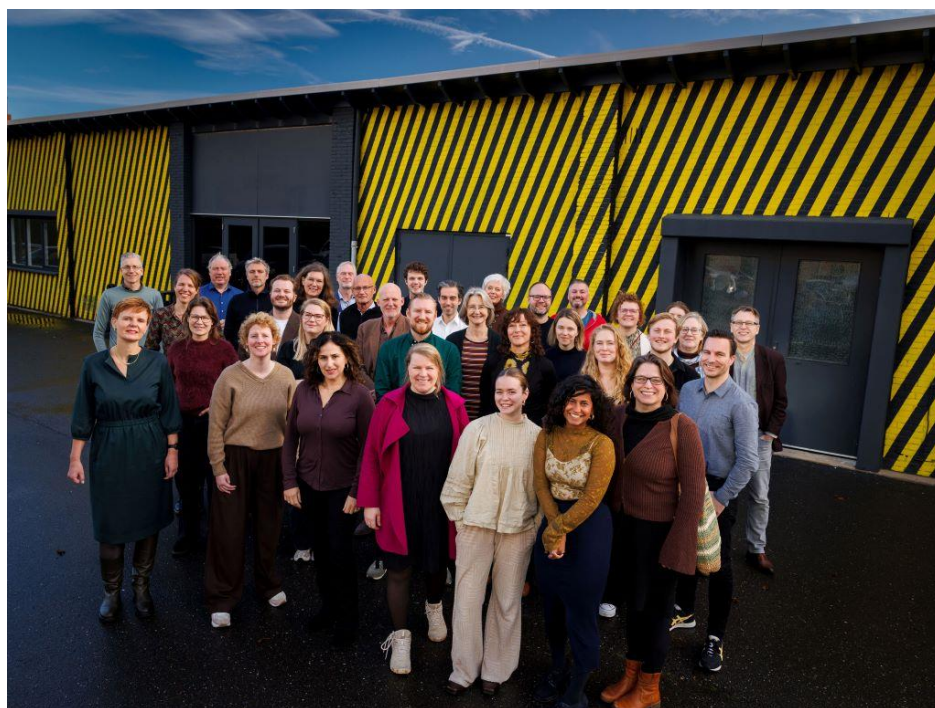
Foto 9: De CoP'ers die aanwezig waren bij de Jaarparade, professioneel vastgelegd door Paul Tolenaar.

Na de presentatie van Christiaan is het tijd voor de lunchpauze. Die benutten we ook om een mooie groepsfoto te maken, waarbij iedereen zich ondanks een knorrende maag laat dirigeren door 'huisfotograaf' Paul Tolenaar.