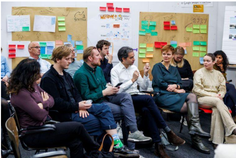
Foto 4: Hoe ga je daar nou mee om, met die onderstroom en bovenstroom?